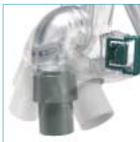
Cotovelo rotativo — flexibilidade da posição do tubo de ar